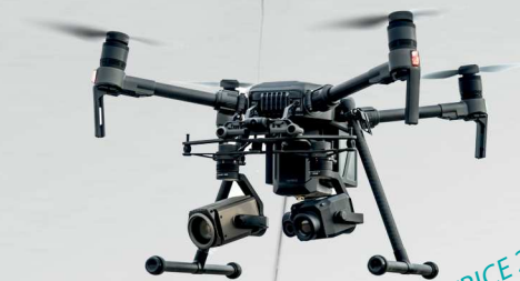
DJI MATRICE 200