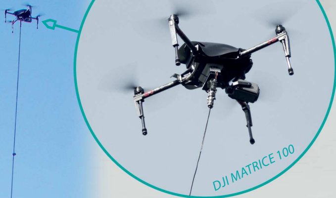
DJI MATRICE 100