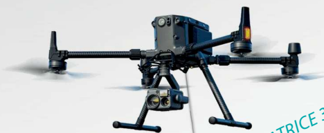
DJI MATRICE 300